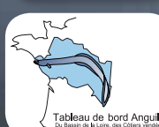
Tableau de bord Anguille Du Bassin de la Loire, des Côtes d'Armor et de la Seine-Normandie