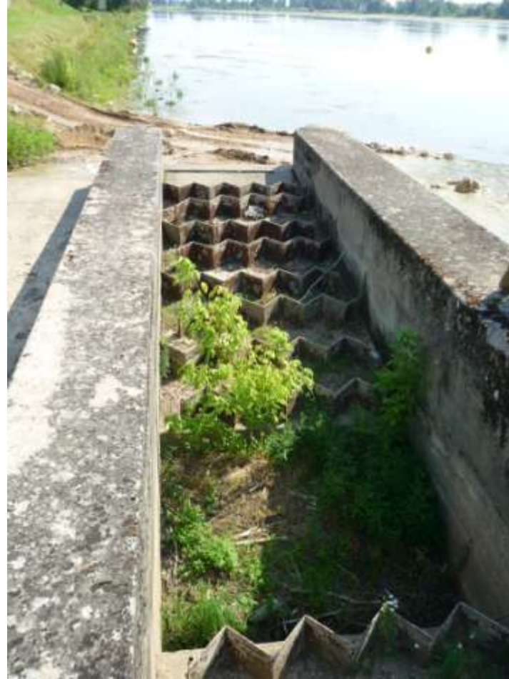
La passe à poissons - 2009

Rencontres Migrateurs de Loire - 29 et 30 octobre 2012, Tours