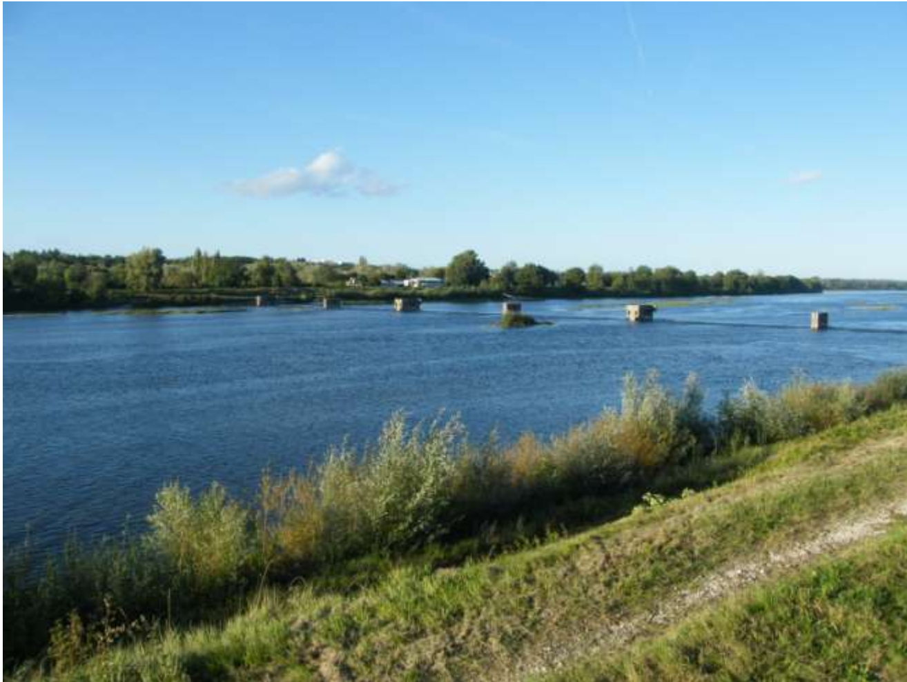
Rencontres Migrateurs de Loire - 29 et 30 octobre 2012, Tours