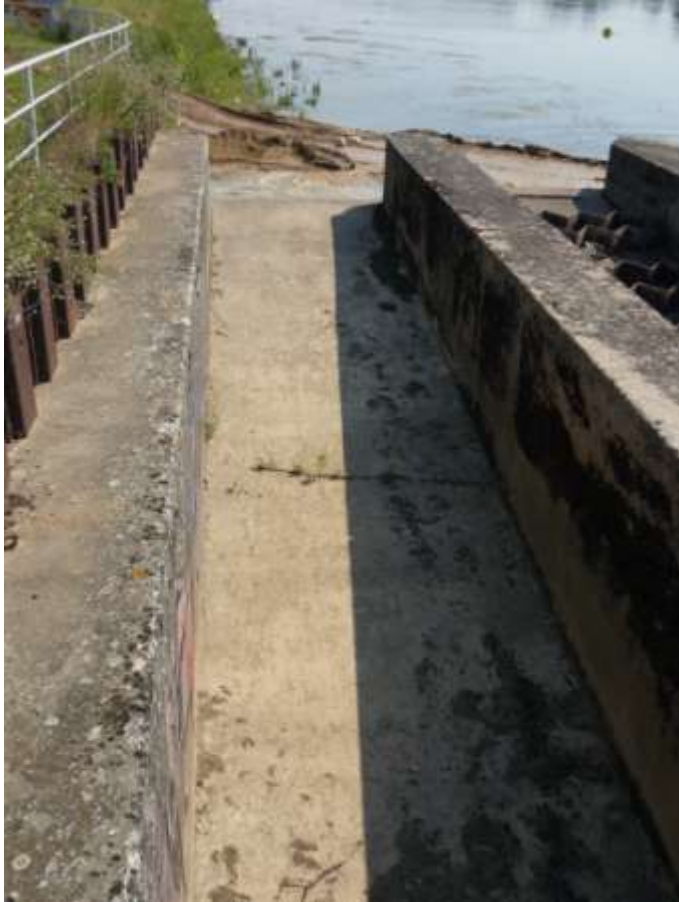
La passe à canoës

Rencontres Migrateurs de Loire - 29 et 30 octobre 2012, Tours